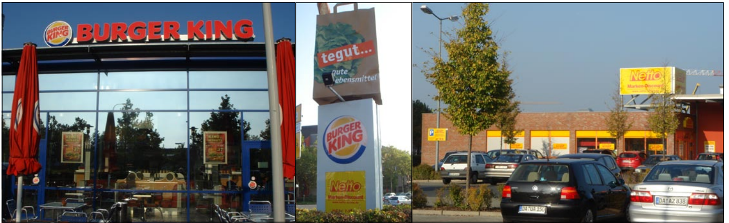
K/S Euro Ejendomme - Darmstadt, 3 solide lejere samlet i et K/S.