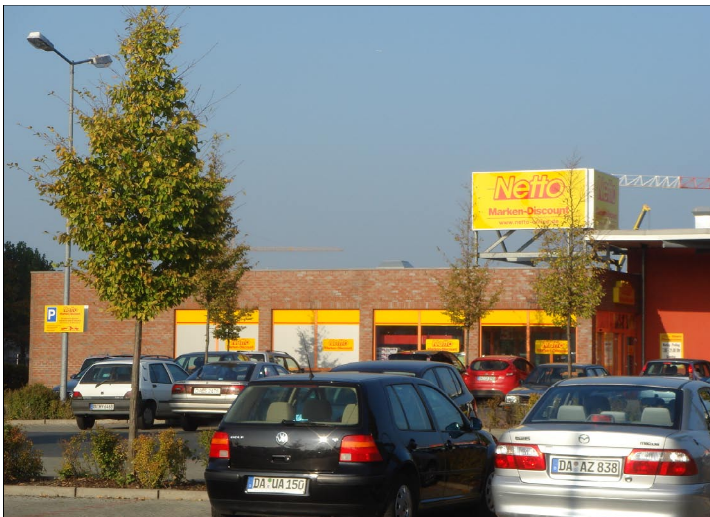
K/S Euro Ejendomme - Darmstadt

Vurderingen af en virksomheds nøgletal fører til et 3-cifret resultat mellem 100 og 600. 100 er den absolut bedste karakter og 600 den ringeste. Netto Marken-Discount AG & Co KG er vurderet til 234, tegut er vurderet til 183 og Burger King v/ Lothar Skala GmbH & Co. til 264 , hvilket er udtryk for, at lejerne repræsenterer en høj kreditværdighed. Eksempelvis er det kun 4% af de 2,4 mio. virksomheder, Creditreform vurderer, der opnår et bonitetstal under 200.