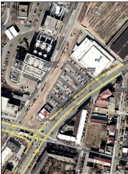
K/S Euro Ejendomme - Darmstadt, beliggende få hundrede meter fra centrum på befærdet ringvej.