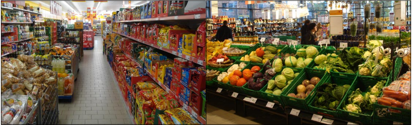
K/S Euro Ejendomme - Darmstadt.

Darmstadt betegner sig som "videnskabsby" og er centrum for teknologiregionen Starkenburg Rhein-Main-Neckar. Byens virksomheder profiterer af beliggenheden i en internationalt præget region med Rhein-Main-Lufthavnen kun 20 minutter fra bygrænsen.